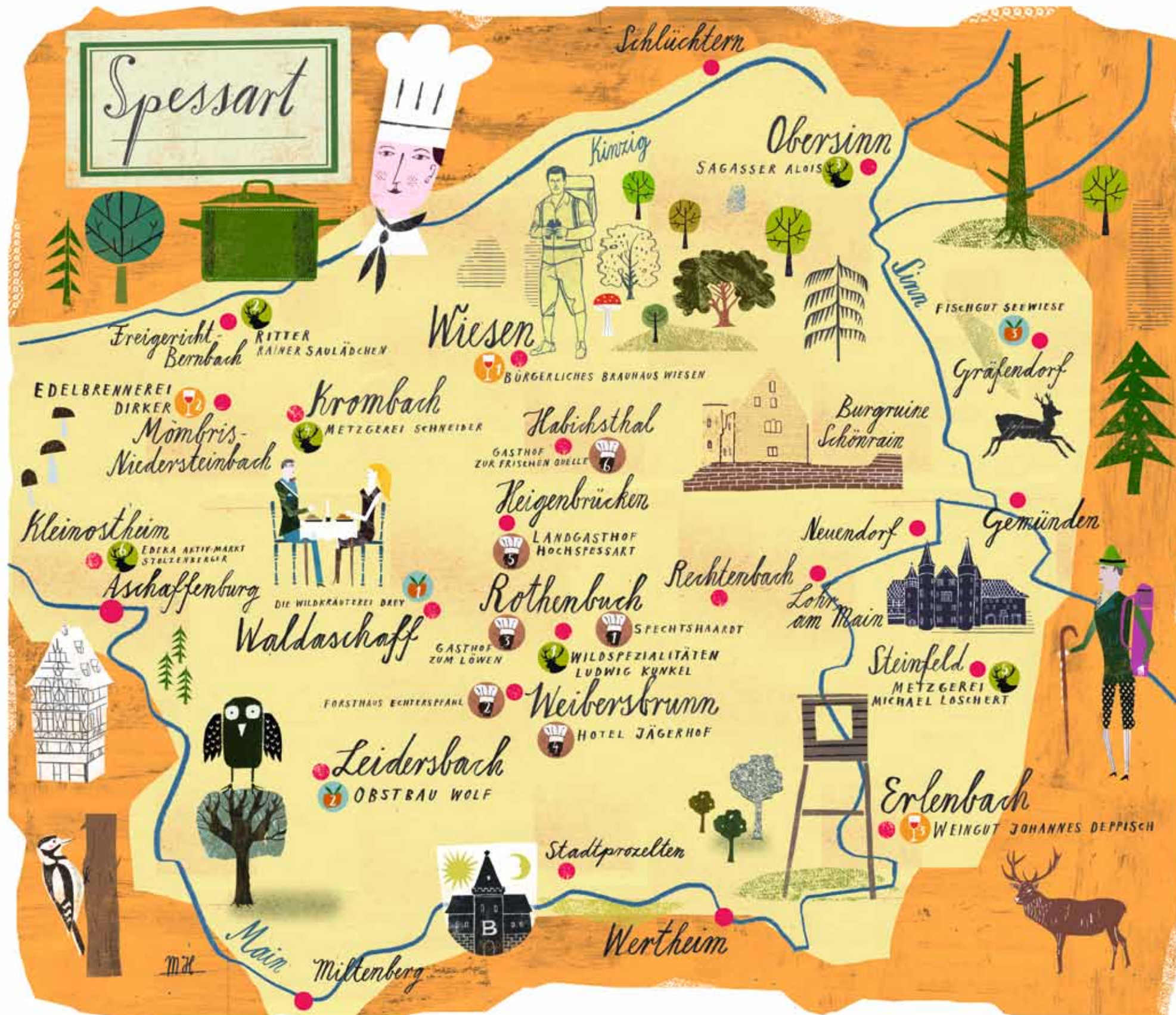
ILLUSTRATION: MARTIN HAAKE

Die Wirtshäuser im Spessart sind berühmt, nicht nur für Schmorgerichte und Würstchen aus Wildschwein und Reh – freuen Sie sich auch auf Lakefleisch aus dem Lagerfeuer, Wildkräuter und aromatisches Obst, frisch oder frisch gebrannt. Eine Auswahl: